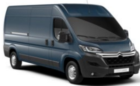
M0ZW | Gris Fer (metalliväri)