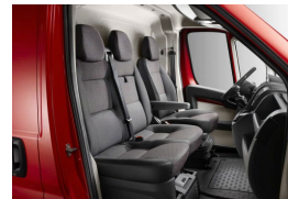
35FX | Darko kangasverhoilu