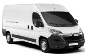
POPR | Ice White (perusväri)