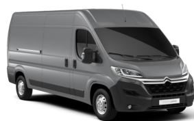
M0F4 | Gris Acier (metalliväri)