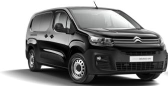
POXY | Noir Onyx (erikoispastelliväri)