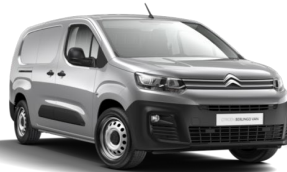
MOF4 | Gris Acier (metalliväri)