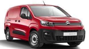
POX9 | Rouge Ardent (erikoispastelliväri)