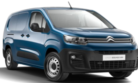
MOJG | Deep blue (metalliväri)