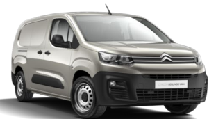
MOEU | Sable Beige (metalliväri)