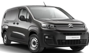
MOVL | Gris Platinum (metalliväri)