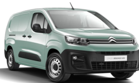
POSW | Aqua Green (metalliväri)