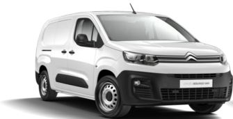
POWP | Blanc Banquise (perusväri)