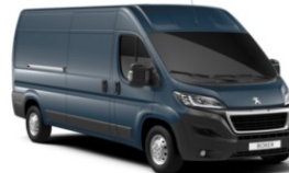
M0ZW | Gris Fer (metalliväri)