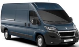
M0ZW | Gris Fer (metalliväri)