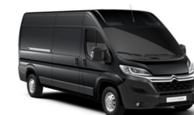
M0E9 | Gris Graphito (metalliväri)