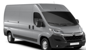
M0ZR | Gris Aluminium (metalliväri)