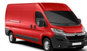
PO1X | Rouge Tiziano (perusväri)