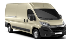
M0H8 | Golden White (metalliväri)