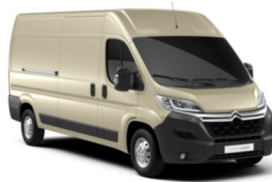
M0H8 | Golden White (metalliväri)