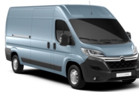
M04F | Bleu Lago Azzuro sininen (metalliväri)