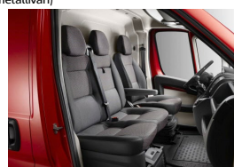
35FX | Darko kangasverhoilu