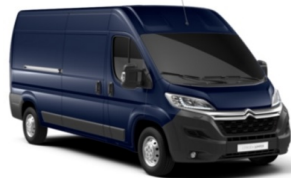
P04P | Bleu Imperial (perusväri)