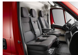
35FX | Darko kangasverhoilu